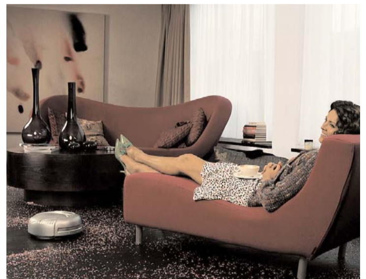
Laissez travailler le spécialiste !